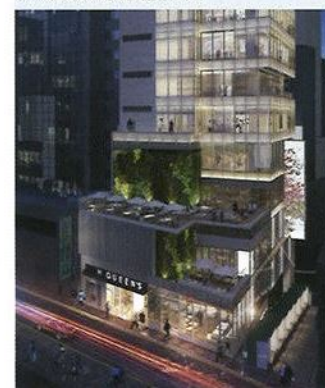
H Queen's 地址：中環皇后大道中80號